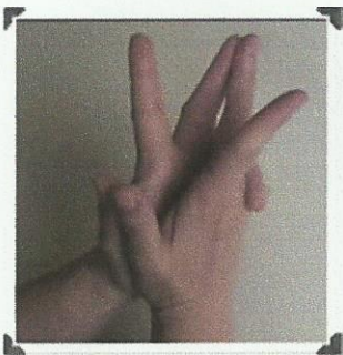
Le bravo des doigts