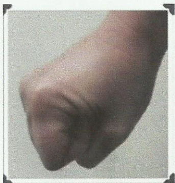
Le poing ouvert et fermé