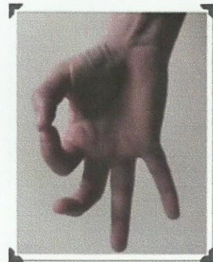
Le bonjour du pouce