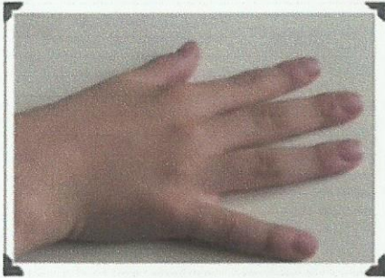
Le piano plat